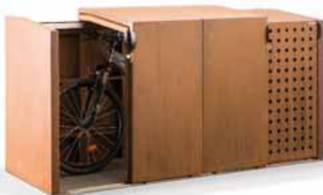
Mülltonnen- und Fahrradbox XANTEN mit 4 Schiebetüren – als Fahrradbox