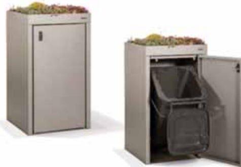
Mülltonnenbox ZITTAU in farbeschichtet nach RAL/DB mit begrünbarem Pflanzdach