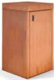
Mülltonnenbox ZITTAU in Cortenstahl für 120 l Mülltonne