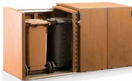
Mülltonnen- und Fahrradbox XANTEN mit 4 Schiebetüren – als Mülltonnenbox