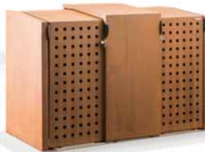
Mülltonnen- und Fahrradbox XANTEN mit 3 Schiebetüren