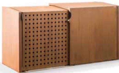
Mülltonnen- und Fahrradbox XANTEN mit 2 Schiebetüren