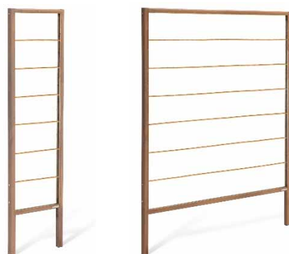
Beispiel WANDA VARIO mit Einzelleisten mit individuellem Abstand