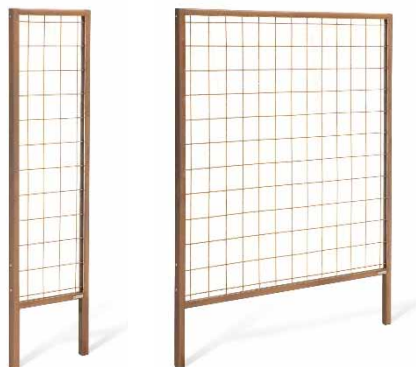
Beispiel WANDA VARIO mit Schweißgitter als Rankhilfe