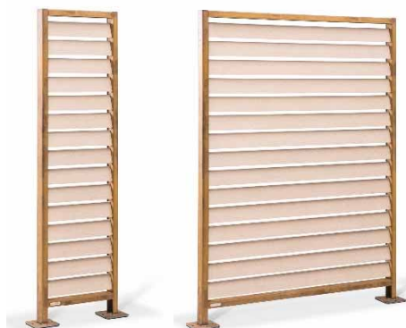
WANDA VARIO mit RESYSTA®-Rhombuslamellen