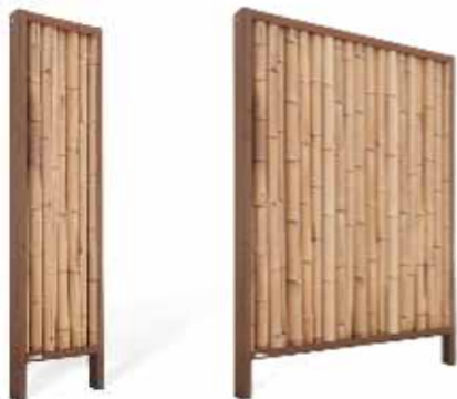
Beispiel WANDA VARIO mit Bambusrohren