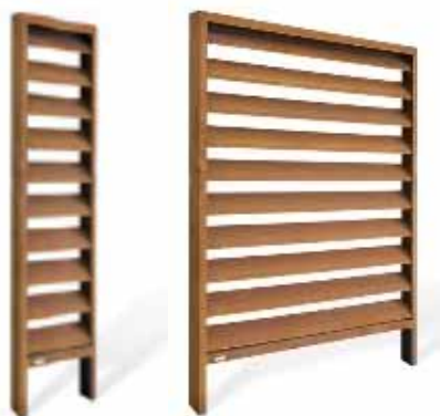
Beispiel WANDA VARIO mit Metall-Lamellen Beispiel