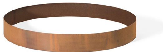
Pflanzring RONDA MASSIV