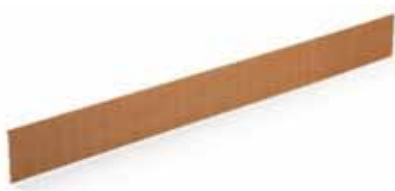
ECO-FALZ-LINER GERADE – Länge 2.000 mm