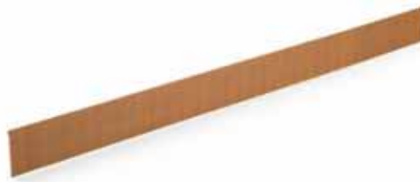
ECO-FALZ-LINER GERADE – Länge 3.000 mm