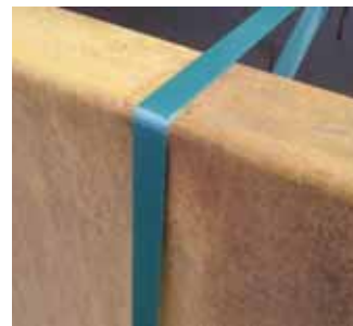
Abdrücke durch Spanngurte etc. beim Transport oder durch Kontakt bei der Lagerung