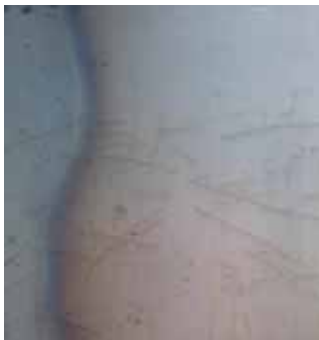
Beispiel für walzblanke Oberfläche

Je nach Temperatur, Luftfeuchte, Sonneneinstrahlung (UV-Strahlung), mikroskopischer Oberflächenstruktur, Qualität der einzelnen Materialchargen und Beschaffenheit der Walzhaut bilden sich unterschiedlich braune Farbnuancen auf der Oberfläche aus. Innerhalb von drei Jahren gleichen sich diese sukzessive der typischen kastanienfarbenen Oberfläche an.