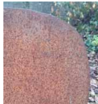
Beispiel für Cortenstahl nach mehr als drei Jahren Bewitterung