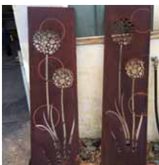
Saugerabdrücke (= Kornkreise), die erst nach dem Berosten in der jungen Oberfläche sichtbar werden