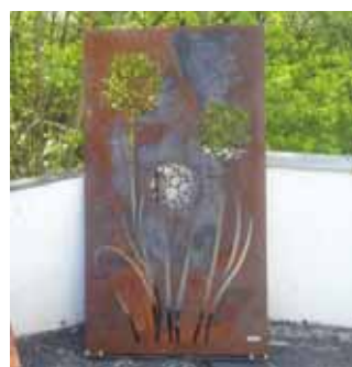
Schwarze Verfärbungen durch Feuchtigkeit und Luftabschluss unter der Verpackung