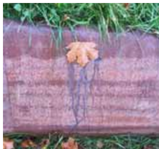
Schwarze Verfärbungen durch organische Objekte auf der jungen Oberfläche