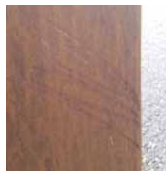
Kratzer in der jungen Oberfläche, z.B. durch Transport, Montage etc.