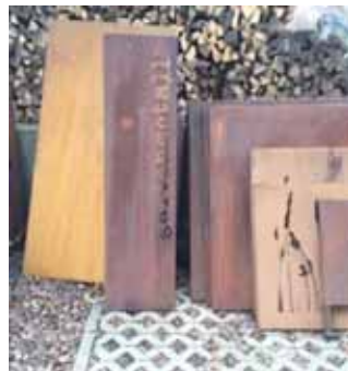
Beispiel für berosteten Cortenstahl nach 0 bis 12 Monaten