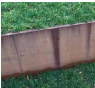
Unterschiedliche Farben durch Ablauf von Oberflächenwasser

Grundsätzlich ist bei jungem Cortenstahl mit unterschiedlichen Oberflächenfarben und -schattierungen zu rechnen. Dies berechtigt nicht zur Reklamation.