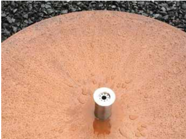
Versiegelter Cortenstahl bei einer Wasserschale AQUA BOWL

Auch zur Reduzierung von rostroten Ablagerungen und zum "Schutz" von Cortenstahl, besteht die Möglichkeit, die rostige Oberfläche zu versiegeln, sobald sich die gewünschte Edelrostoberfläche mit der dazu passenden Schutzschicht ausgebildet hat.