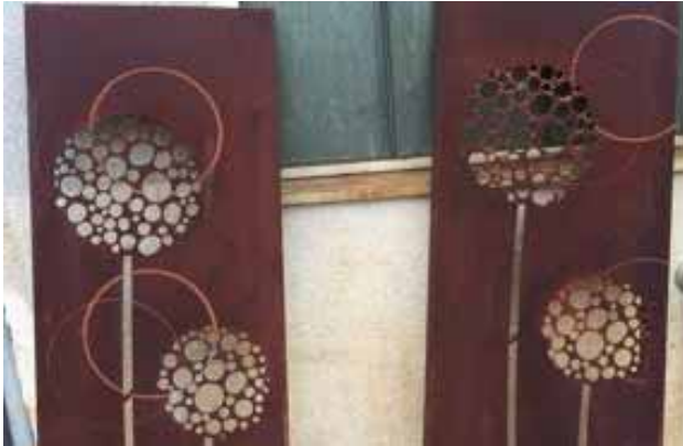
Saugerabdrücke (=Kornkreise) nach dem ersten Berosten

Beim Verarbeiten der Rohplatten werden diese an mehreren Fertigungsstationen automatisiert mit Hilfe von Vakuumsaugern gegriffen und zur Weiterverarbeitung transportiert. Oft bleiben nach dem ersten Berosten der Oberfläche Abdrücke sichtbar. Mal weniger, mal sehr deutlich sichtbar.