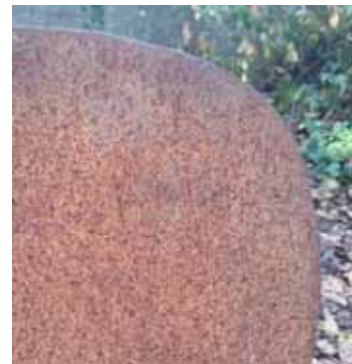
Beispiel für Cortenstahl nach mehr als drei Jahren Bewitterung

Unterschiedliche Färbungen nach dem ersten Berosten gleichen sich mit fortschreitender Bewitterung der Objekte immer mehr an. Diese sind kein Mangel und berechtigen daher nicht zur Reklamation.