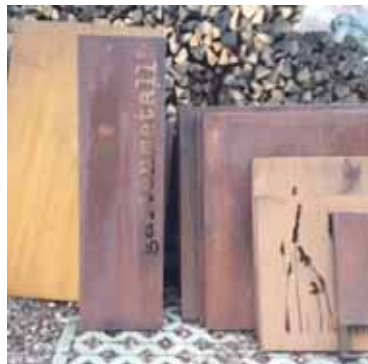
Beispiel für berosteten Cortenstahl mit unterschiedlichen Farben nach dem ersten Berosten