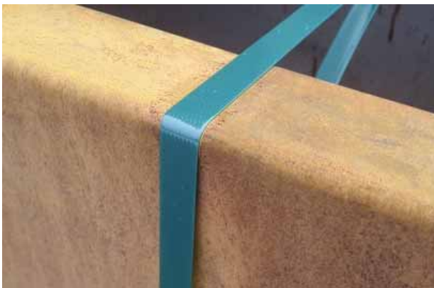
Abdrücke von Spanngurten entstehen beim Verpacken

Diese Struktur (in Fachkreisen auch "Kornkreise" genannt) entsteht dadurch, dass beim Auftragen der SUPER ROST-Mittel durch minimale Restpartikel, die an den Saugern haften, die Oberfläche gestört wird. Der Abdruck wird erst nach Ausbildung der ersten Rotrost-Patina nach 12 h bis 24 h sichtbar. Bei natürlicher Bewitterung verschwindet der Abdruck jedoch wieder. Das Auftreten der Vakuumsaugerabdrücke auf der vorgerosteten Oberfläche berechtigt daher nicht zur Reklamation.