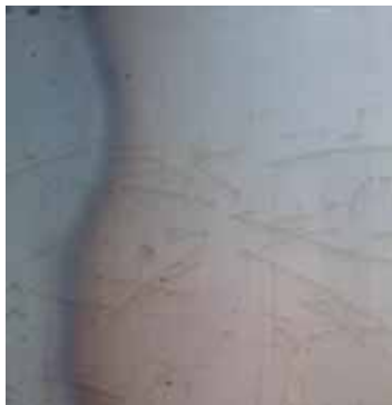
Beispiel für walzblanke Oberfläche vor der Bewitterung

Allerdings führt das unregelmäßige Erscheinungsbild auch immer wieder zu Reklamationen. So können sich die Oberflächenfarben, insbesondere in den ersten Monaten unterschiedlich entwickeln und gleichen sich erst nach bis zu drei Jahren an. Auch Abdrücke, schwarze Flecken und ungleich vorgerostete Stellen können für Unregelmäßigkeiten sorgen, die sich ebenfalls erst nach einigen Monaten auflösen.