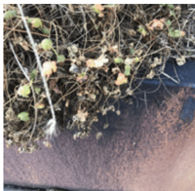
Schwarze Verfärbungen durch organische Elemente