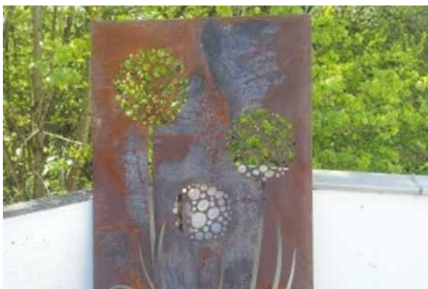
Schwarze Verfärbungen unter Luftabschluss und Feuchtigkeit auf der jungen Oberfläche

Ebenfalls zu temporären schwarzen Verfärbungen kann es im Herbst kommen, wenn sich abgestorbene Blätter an der Oberfläche sammeln oder dort bewegen. Auch hier gilt: nach dem Entfernen stellt sich unter der natürlichen Bewitterung bald wieder die bekannte Edelstoberfläche ein.