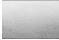
Edelstahl Oberfläche nach Absprache Werkstoff-Nr.: 1.4404, V4A