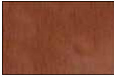
Edelrostopfik Cortenstahl vorgerostet Werkstoff-Nr.: 1.8965